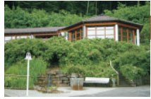
Schullandheim mit Pavillon heute