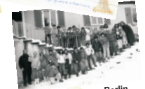
Schulklasse aus Berlin