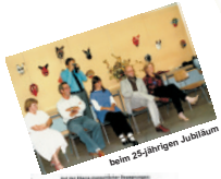
beim 25-jährigen Jubiläum