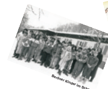
Berliner Kinder im Schnee